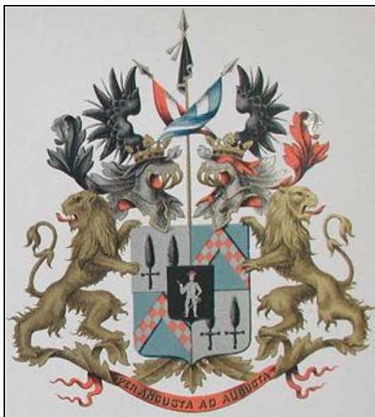
Wapen van het geslacht Van Verschuer.