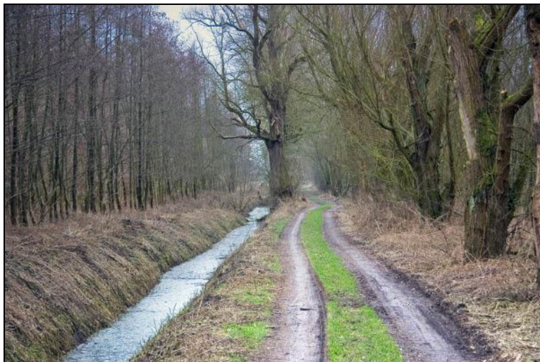
Een prachtige notenlaan op het landgoed Mariënwaerd.

Ten zuiden van het huis bevindt zich ook – zoals een landgoed wel betaamt – een grote moestuin, met zoals gebruikelijk diverse kassen en broeibakken.