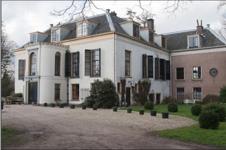
De witgepleisterde achtergevel van het Huis Mariënwaerd.

hoofdvleugel van twee bouwlagen met een schilddak; de bovenste verdieping (de bel-etage) is aanmerkelijk hoger dan de begane grond.