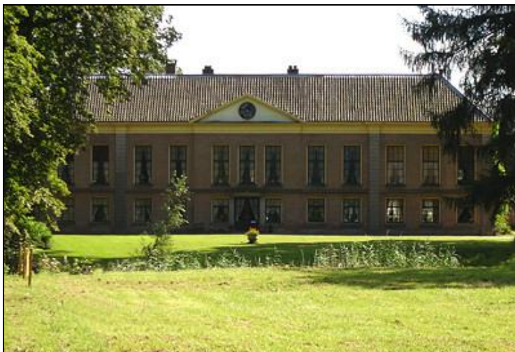
De classicistische façade van het Huis Mariënwaerd.