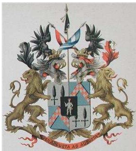
Wapen van het geslacht Van Verschuier, sinds 1920 heren van Leur.