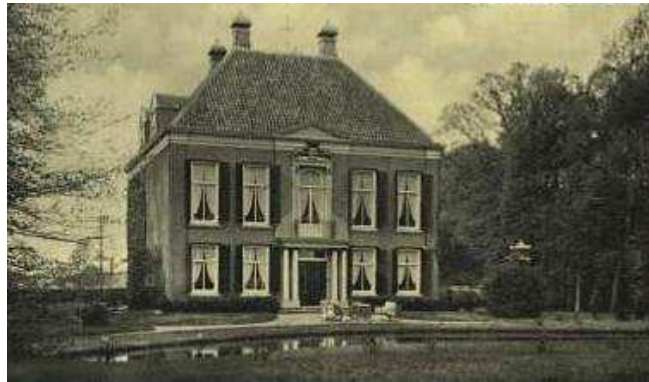
Huis te Leur, 1937.

omlijst door dubbele pilasters, waarvoor twee paar Ionische zuilen staan die de kroonlijst erboven – met balkonhek – torsen. In de middenrisaliet bevindt zich op bel-etage niveau een balkondeur met half rond bovenlicht. Pleisterwerk, in een soort welvende curve aangebracht op de muur, zorgt optisch voor een sierlijke overgang van de vrij smalle omlijsting van de balkondeuren naar de brede, ietwat stoere deurpartij op de begane grond.