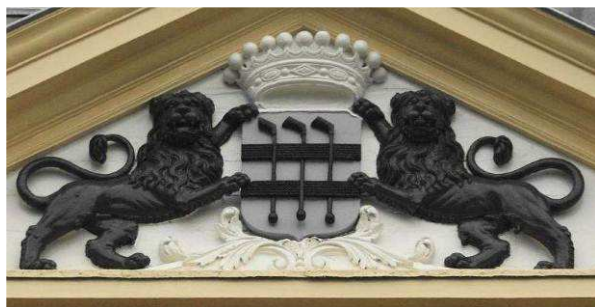
Wapen Van Balveren in de timpaan van Kasteel Hoekelum (Bennekom)

Het Huis te Leur, zo mag uit deze beknopte beschrijving blijken, is een statig, charmant en gerieflijk huis in een landelijke en arcadische omgeving – een ensemble dat allesbehalve teleur stelt!