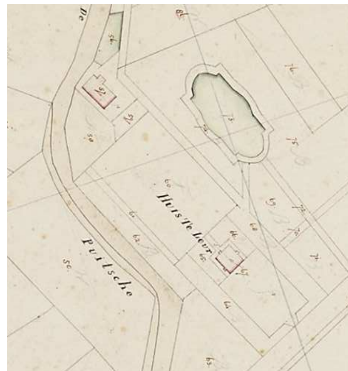
Kadastrale kaart (detail) van het Huis te Leur, circa 1820-1830.

huis en een 18 e -eeuws koetshuis met stalling, onder een pannen en rietgedekt afgewolfd zadeldak. In het bestek uit 1778 was ook de “aanbouw voor stalling en koetshuis” opgenomen, dat plaats bood aan zes paarden en een aantal rijtuigen.